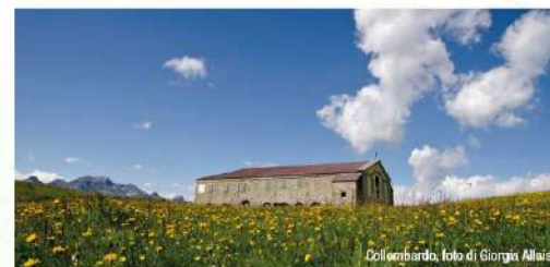
Collobardo, foto di Giorgia Allais.