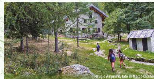
Rifugio Amprimo, foto di Marco Cicchelli.

Tracclati a bassa quota per rifugi adatti a famiglie